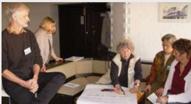
Bild: Workshop zur Gründung einer Landesarbeitsgemeinschaft für Gemeinschaftliches Wohnen in Rheinland-Pfalz 2007

Wir vermitteln Kontakte zwischen Gleichgesinnten, schaffen Kommunikationsforen und informieren über Entwicklungen und Trends zum Thema Wohnprojekte in Rheinland-Pfalz. Wir beraten Initiativen in der Startphase und vermitteln ExpertInnen und Kontakte.