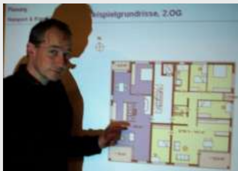
Bild: Architekt erläutert Grundriss

Insbesondere ältere Menschen, Alleinstehende oder junge Familien können vom Leben in Wohnprojekten profitieren.