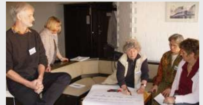
Bild: Gründung einer Landesarbeitsgemeinschaft in RLP 2007

In der Landesarbeitsgemeinschaft „Mehr als Wohnen RLP“ beispielsweise sind ErfahrungsexpertInnen, ProjektbewohnerInnen, Startergruppen, FachexpertInnen und Neuinteressenten sowie die Politik gefragt.